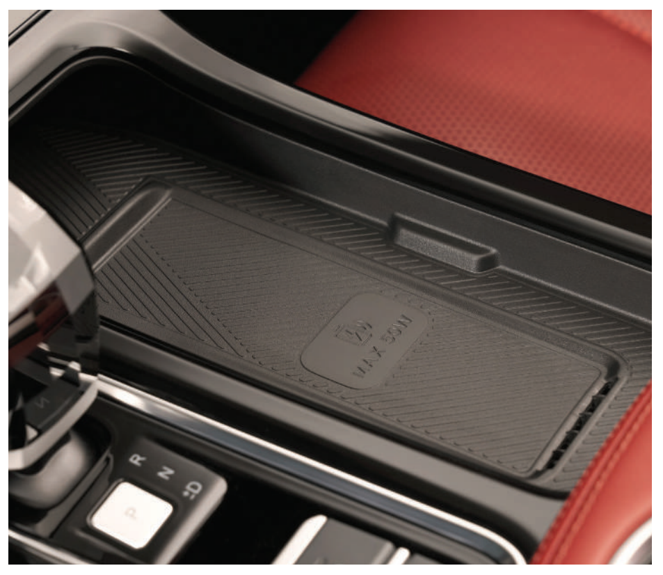
50W Wireless Fast Charging

Each seat has its own temperature. Other than buttons for climate control for driver and passenger seats, there is a touchscreen of climate control for the second row. Each person in the vehicle is a VIP.