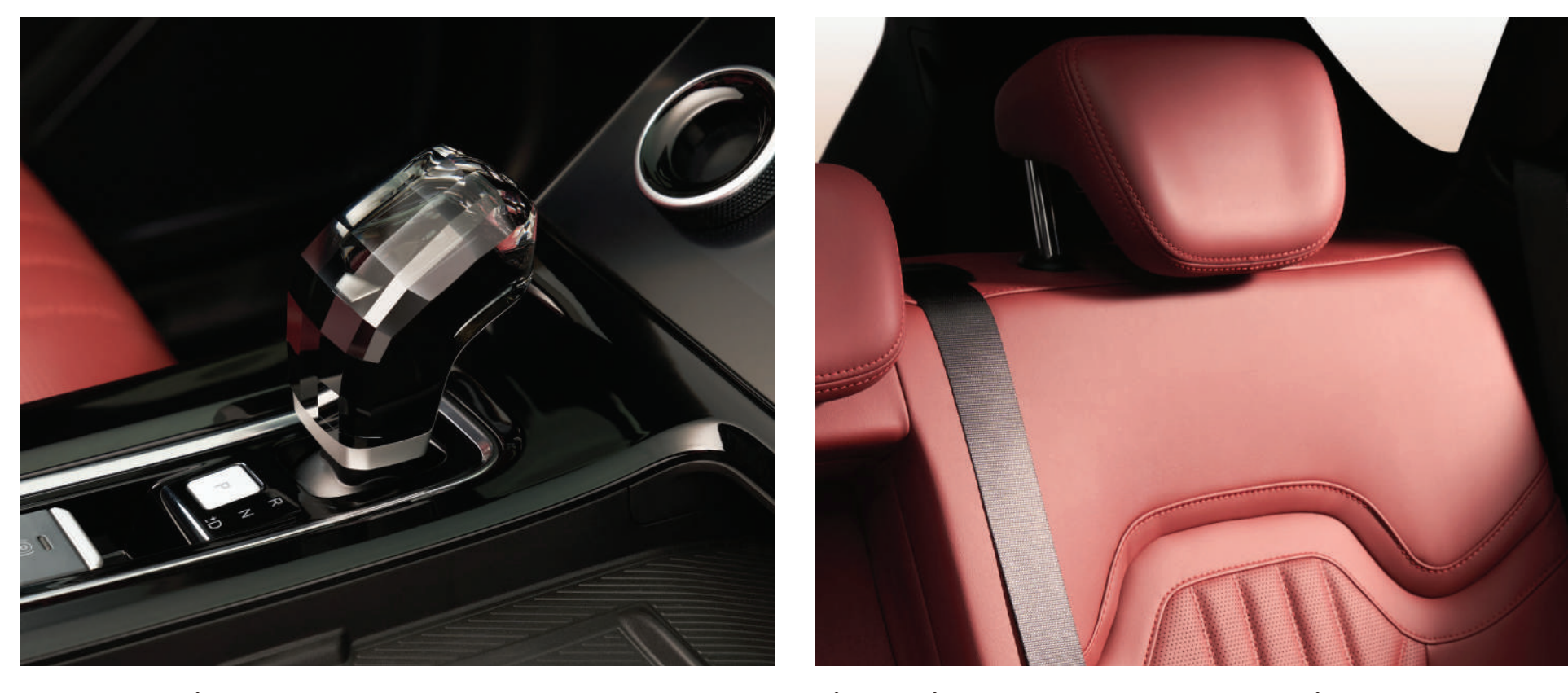
Crystal Ge As dazzling as

Fast charging your phone, freer without wires.