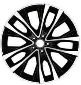
Blaze Blast R20