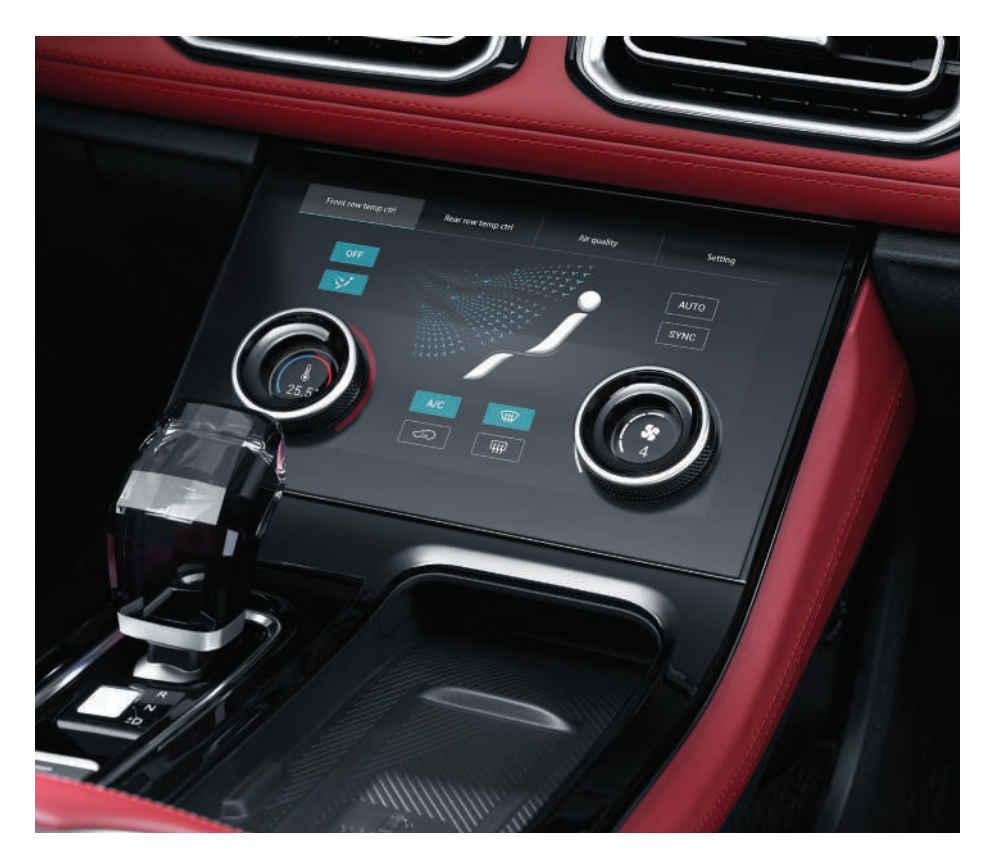
3-Zone Climate Control + Touchscreen Climate Control in 2nd Row

Each seat has its own temperature. Other than buttons for climate control for driver and passenger seats, there is a touchscreen of climate control for the second row. Each person in the vehicle is a VIP.