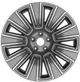
Star Ring R19